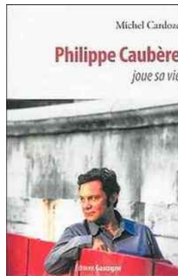
Un livre passionnant