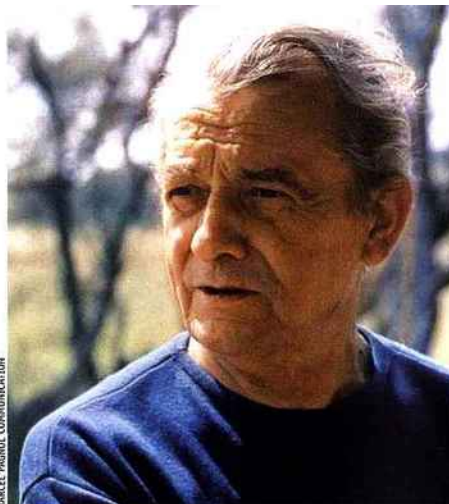
MARCEL PAGNOL COMMUNICATION